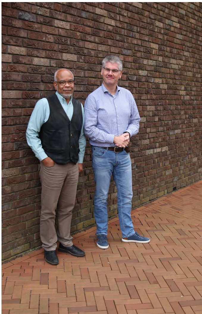
Team sociaal raadslieden

De sociaal raadslieden (SR) geven informatie, advies en concrete hulp bij vragen en problemen op het gebied van sociale zekerheid, belastingen, huisvesting, juridische kwesties, arbeidsrecht, familierecht, onderwijs en maatschappelijke voorzieningen.