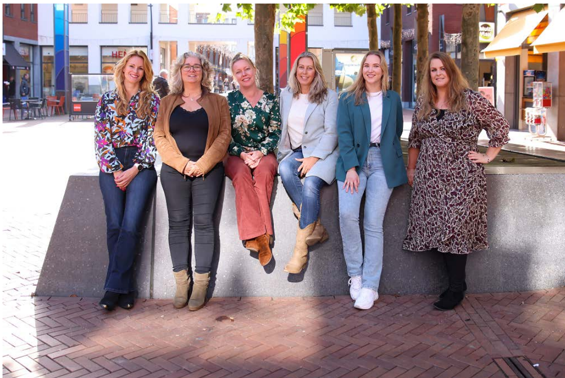
Team algemeen maatschappelijk werk

In het verslagjaar worden een aantal assertiviteitstrainingen aangeboden.